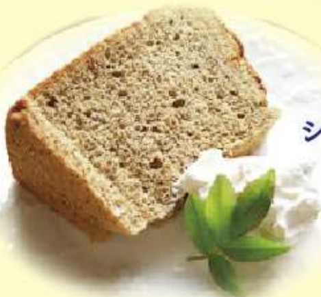
シフォンケーキ 520円 (税込)