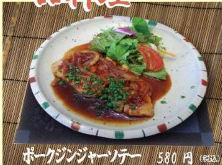
ポークジンジャーソース 580円 (税込)