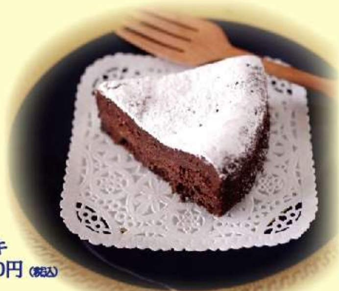
ショコラケーキ 480円 (税込)