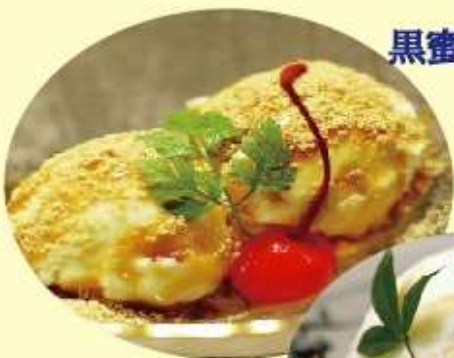
黒蜜きなこアイス 480円 (税込)