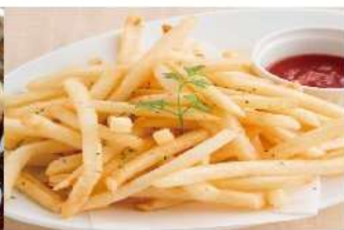
ポテトフライ 300円 (税込)