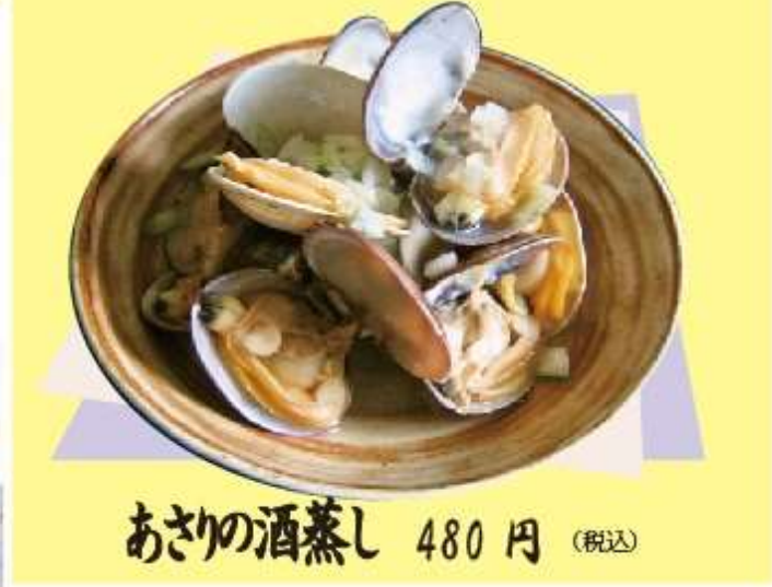
あさりの酒蒸し 480円 (税込)