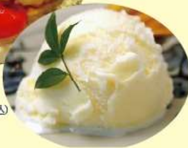
バニラアイス 290円 (税込)