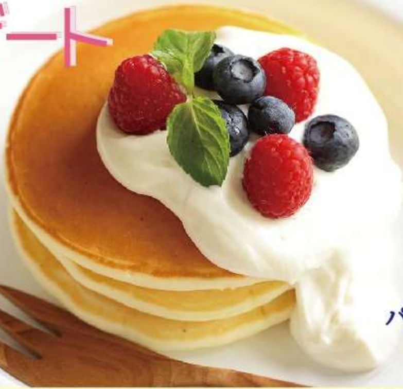
パンケーキフルーツ添え 580円 (税込)