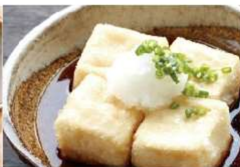
揚げ出し豆腐 380円 (税込)