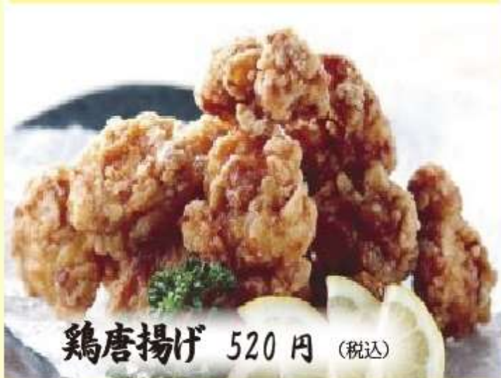
鶏唐揚げ 520円 (税込)