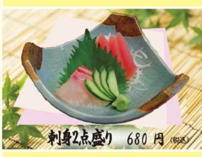
刺身2点盛り 680円 (税込)