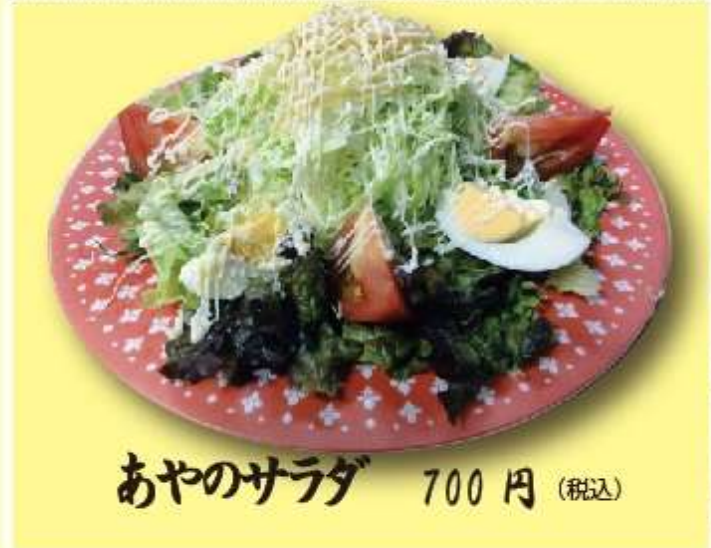
あやのサラダ 700円 (税込)