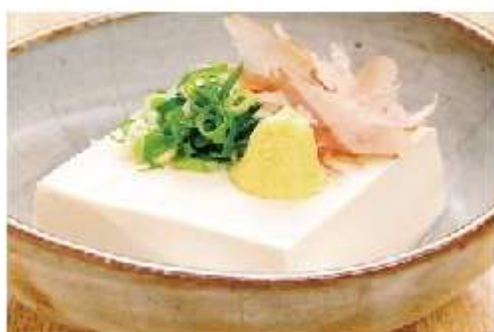
冷奴 300円 (税込)