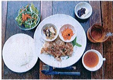
※写真はお肉がメインのセット例です。